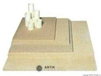
Zakládací SET XT 160 (4 pláty, stojky) 9 680 Kč