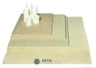
Zakládací SET CBN 70 (3 pláty, stojky) 5 748 Kč