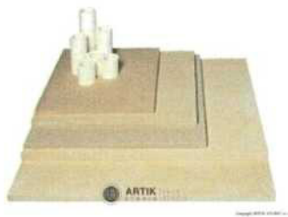
Zakládací SET XT 120 (4 pláty, stojky) 9 680 Kč