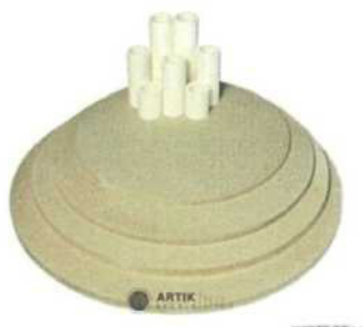
Zakládací SET Top 60 (4 pláty, stojky)