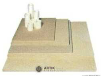
Zakládací SET XT 330 (10 plátů, stojky) 26 620 Kč