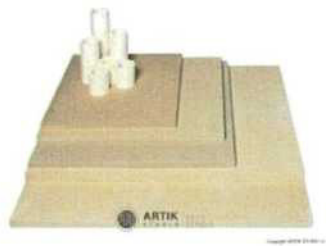
Zakládací SET XR 1060 (28 plátů, stojky) 53 845 Kč