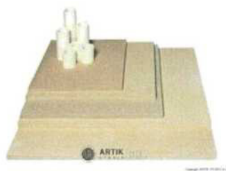
Zakládací SET XR 780 (14 plátů, stojky) 39 023 Kč