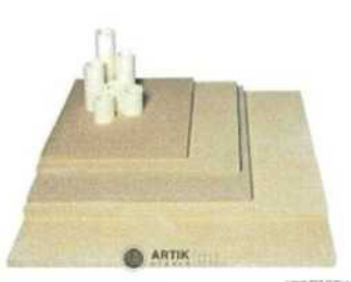
Zakládací SET N 100 (4 pláty, stojky)