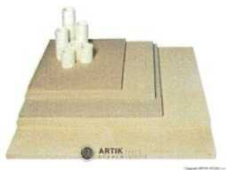
Zakládací SET XT 200 (4 pláty, stojky) 12 705 Kč