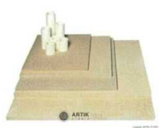
Zakládací SET XR 190 (4 pláty, stojky)