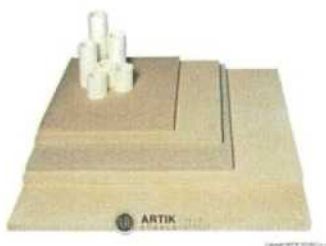
Zakládací SET XT 270 (5 plátů, stojky) 15 125 Kč