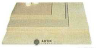
Zakládací SET XR 310 (5 plátů, stojky) 14 520 Kč