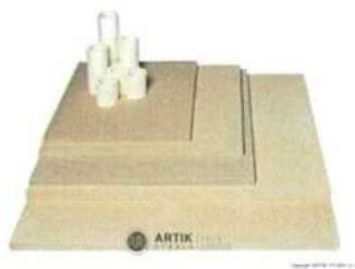
Zakládací SET XR 680 (12 plátů, stojky) 30 250 Kč