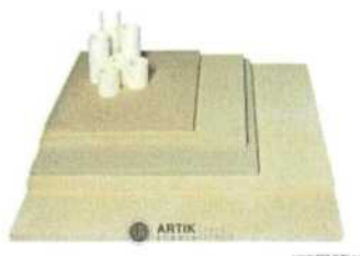
Zakládací SET XR 380 (10 plátů, stojky) 25 410 Kč