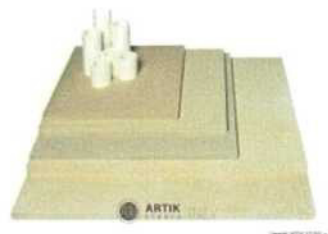
Zakládací SET CBN 50 (3 pláty, stojky) 4 840 Kč