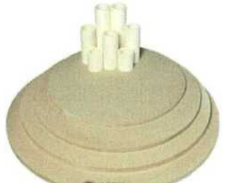
Zakládací SET Top 16 (2 pláty, stojky)