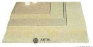
Zakládací SET XT 450 (12 plátů, stojky) 32 368 Kč