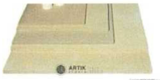
Zakládací SET XT 600 (12 plátů, stojky) 32 368 Kč