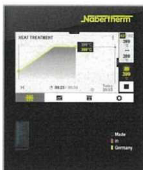
Dodatek na reg. C540 (10 prg., 2xtra fce, 20seg)