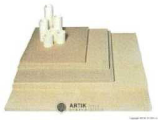
Zakládací SET XR 520 (12 plátů, stojky) 30 250 Kč